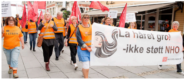
I streik: Fagforbundet har tatt ut 33 frisører i streik.