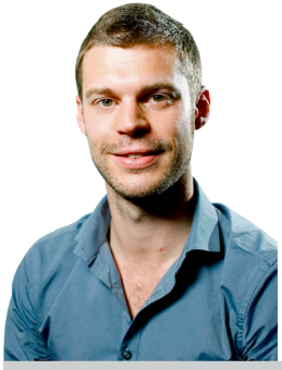
Bjørnar Moxnes b.moxnes@roedt.no Leder i Rødt