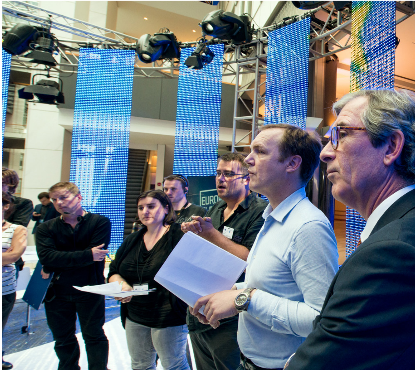
EU-valget: Velgerne straffet sosialdemokratene for kuttpolitikken.

Utgiver: Rødt Dronningens gate 22 0154 Oslo