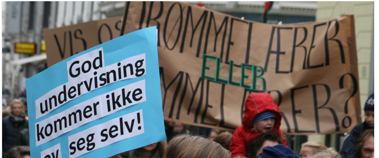
Misnøye: Mange lærere er misfornøyd med skissen til ny arbeidstidsavtale.

– Her har vi vetorett, men til nå har det ikke vært særlig vilje til å bruke denne, konstaterer Rødland.