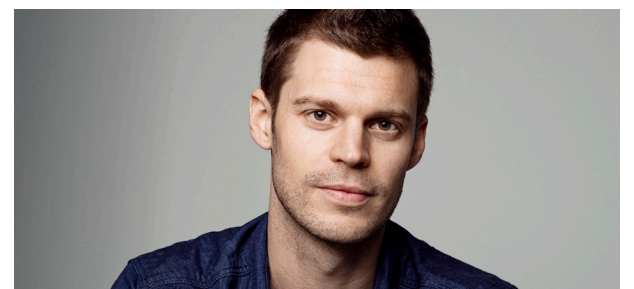
Rødt-leder: Bjørnar Moxnes.

– Rapporten dokumenterer at det er en myte at små sykehus er dyrere og dårligere enn store sykehus. Mindre sykehus har minst like gode behandlingsresultater, er billigere å drive, har færre sykehusinfeksjoner, og er beredskapsmessig