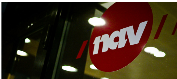
Nav: Vi vet lite om hvordan Nav utøver makt over trygdede.