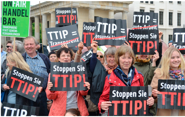
Moter motstand: Demonstrasjon mot TTIP i Tyskland.